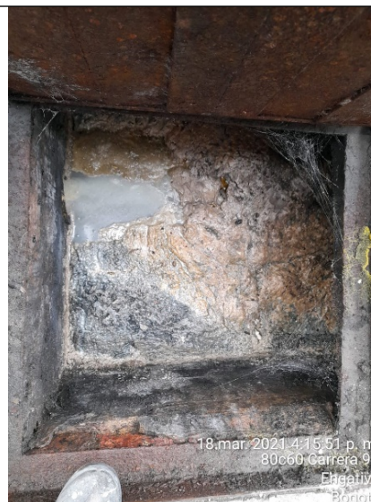
Foto 4. Vista interna trampa de grasas ubicada en la carrera 90 - salida parqueadero.