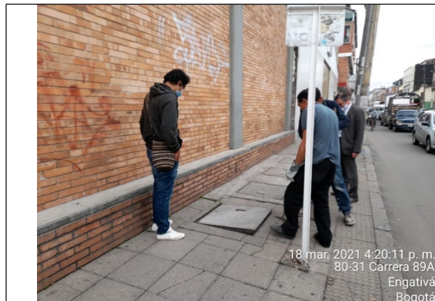
Fotografía No. 1. Vista Panorámica de la caja de inspección externa ubicada en la carrera 89A (centro comercial) cerca a la entrada parqueadero.