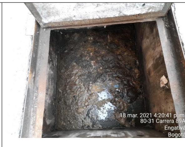
Foto 6. Vista interna trampa de grasas ubicada en la carrera 89A cerca entrada parqueadero.