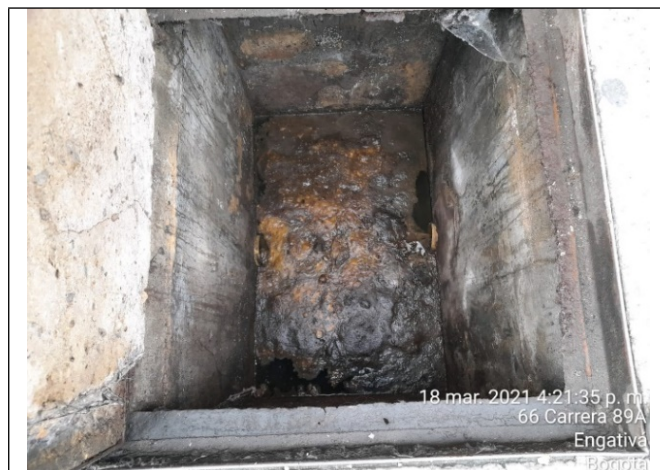
Foto 5. Vista interna trampa de grasas ubicada en la carrera 89A cerca entrada parqueadero.