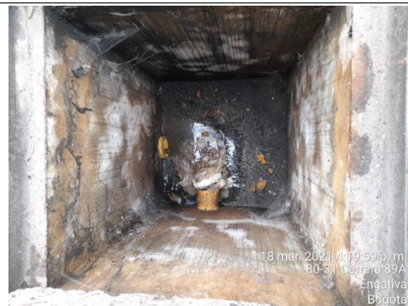
Fotografía No. 2. Vista interna caja de inspección externa ubicada en la carrera 89A (centro comercial) cerca a la entrada parqueadero.

Así mismo, se evidencia en las trampas de grasas del CENTRO PRIMAVERA PLAZA COMERCIAL - PROPIEDAD HORIZONTAL , ubicado en la dirección AV CL 80 N° 89A 40, la acumulación de lodos, grasas y aceites, como se puede verificar en las fotografías No. 3, 4, 5 y 6: