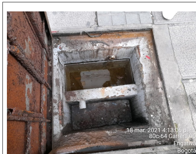
Foto 3. Vista interna trampa de grasas ubicada en la carrera 90 - salida parqueadero.

Así mismo, se evidencia en las trampas de grasas del CENTRO PRIMAVERA PLAZA COMERCIAL - PROPIEDAD HORIZONTAL , ubicado en la dirección AV CL 80 N° 89A 40, la acumulación de lodos, grasas y aceites, como se puede verificar en las fotografías No. 3, 4, 5 y 6: